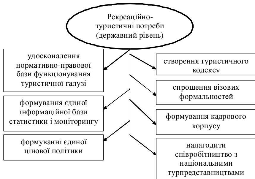
Рис. 2. Шляхи задоволення рекреаційно-туристичних потреб населення на державному рівнях

— введення системи тимчасових пільг для представників туристичної сфери за такими напрямками: фінансові пільги — знижки й позики під низький відсоток; податкові пільги — тимчасове звільнення від сплати податків чи скорочення їхнього розміру; інші пільги — створення системи підготовки кадрів, розробка програм розвитку туристичної сфери [5, с. 256].