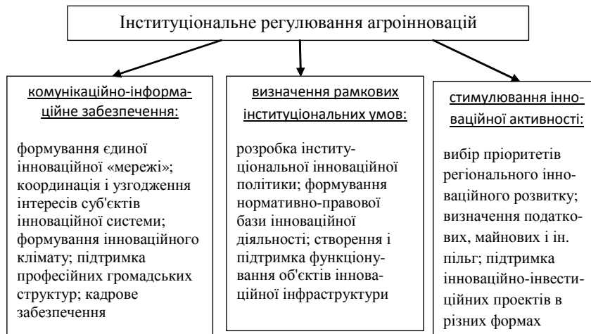
Рис. 2. Складові інституціонального регулювання агроінновацій

сам, через що впливові групи часто звертаються до держави з проханням захисту від конкуренції. З політекономічної точки зору стійкість неефективних інститутів може слугувати наочним відображенням співвідношення владних сил, пануючих у державі.