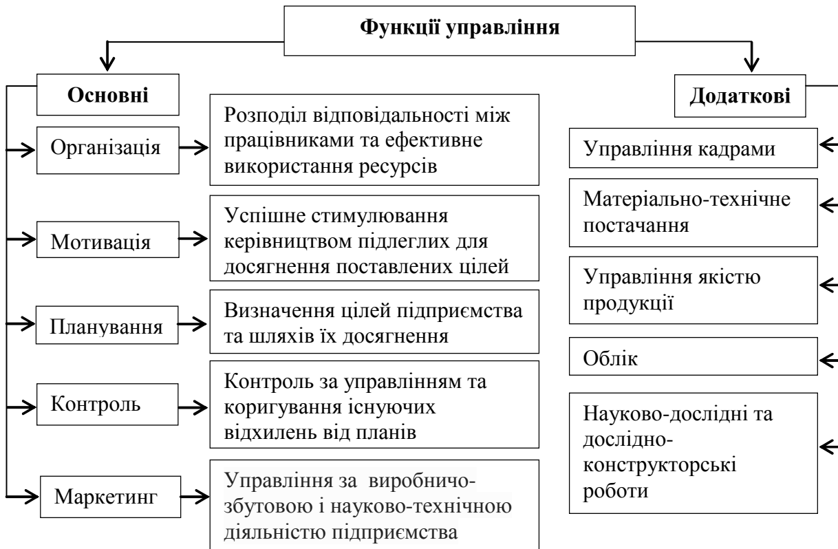
Рис. 1. Функції управління виробничо-господарською діяльністю аграрних підприємств