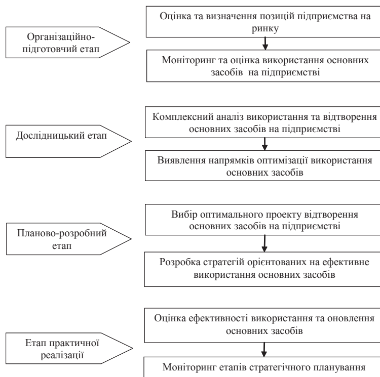
Рис. 2. Алгоритм управління основними засобами машинобудівних підприємств