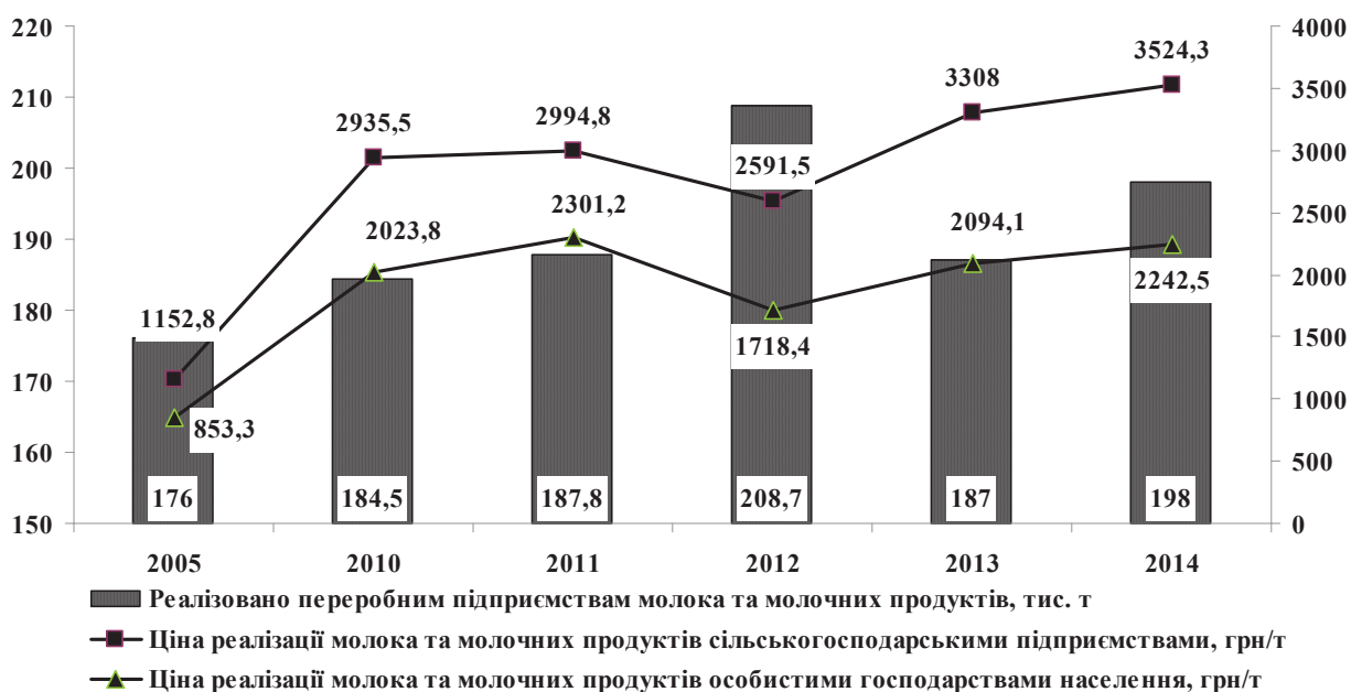
Рис. 2. Динаміка обсягів, цін реалізації молока та молочних продуктів аграрними формуваннями Тернопільської області