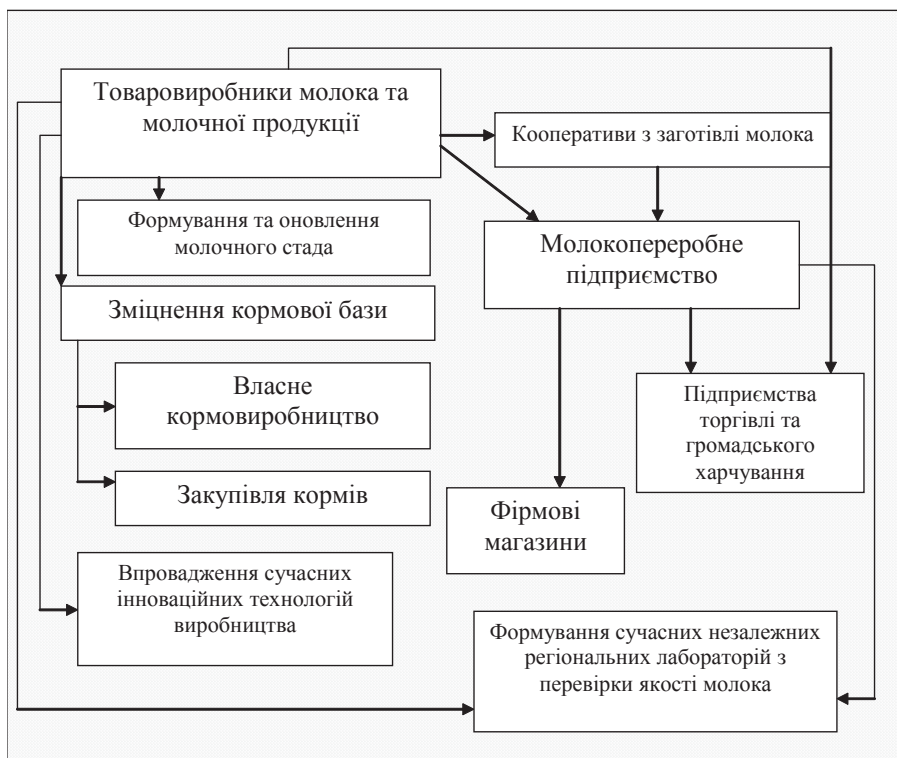
Рис. 3. Взаємовідносини у молокопродуктовому ланцюгу