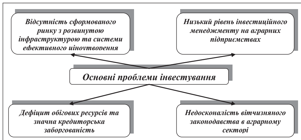
Рис. 1. Основні проблеми інвестування в аграрному секторі України