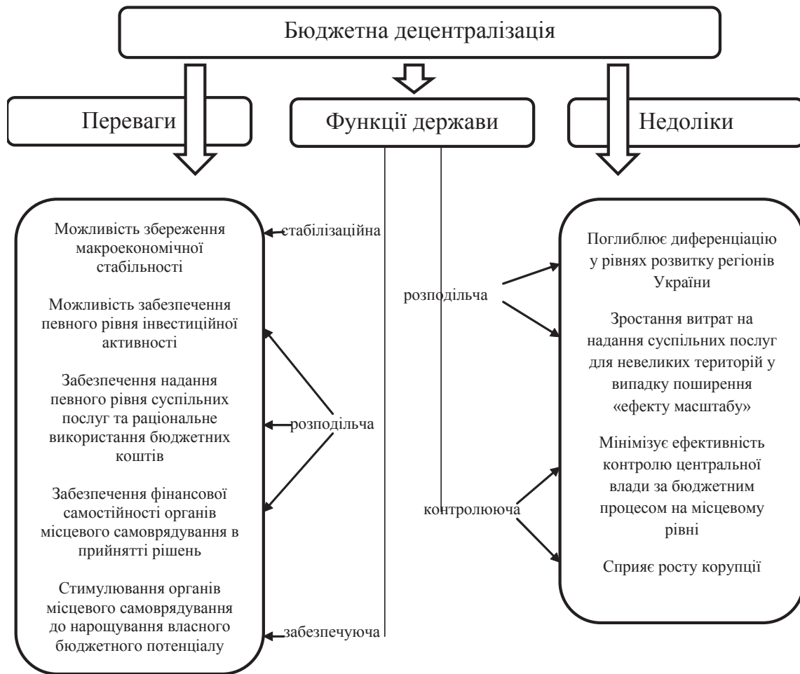
Рис. 2. Переваги та недоліки бюджетної децентралізації