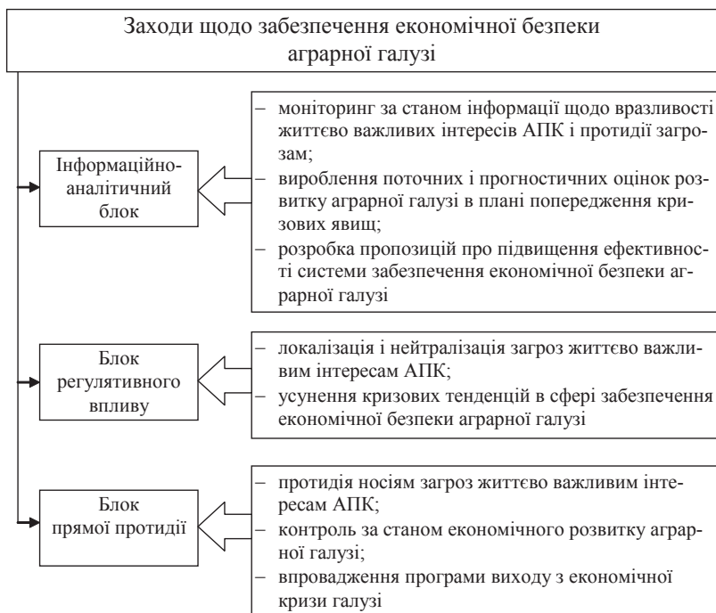
Рис. 3. Концептуальна модель забезпечення економічної безпеки аграрної галузі

Інструмент нівелювання специфічних загроз регіональній економічній безпеці аграрної галузі формується з урахуванням оцінки її рівня і стану в цілому, а також за допомогою деконструованого аналізу значень її показників з метою виявлення якісних характеристик досліджуваного процесу і визначення пріоритетних напрямів економічної аграрної по-