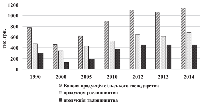
Рис. 2. Показники валової продукції сільськогосподарських підприємств Черкаської області з 1990—2014 рр.

1. Sabluk, P.T. (2007), "Economic mechanism of agricultural complex in a market economic