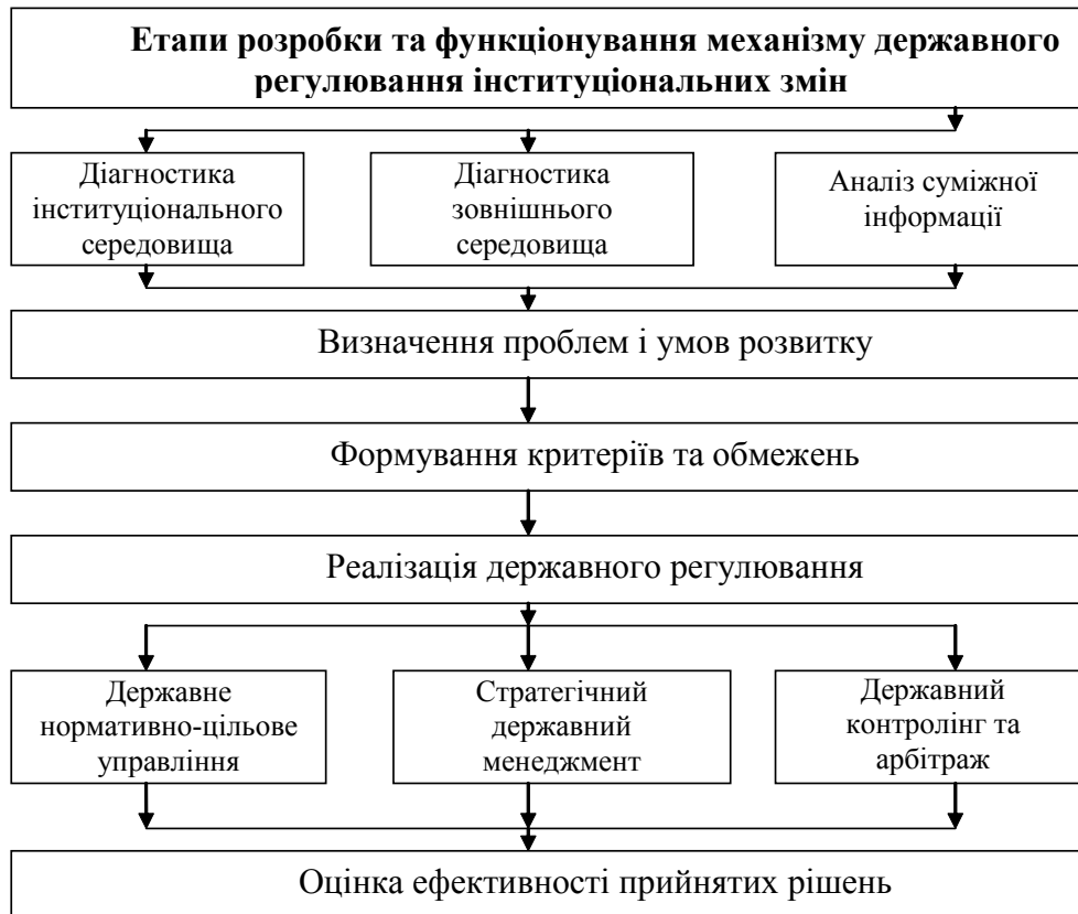
Рис. 2. Процес розробки і реалізації механізму державного регулювання інституціональних змін

віднести чинники, які безпосередньо формують певний інститут, а до зовнішнього можна включити й суміжні інститути, що створюють необхідні інформаційні потоки.