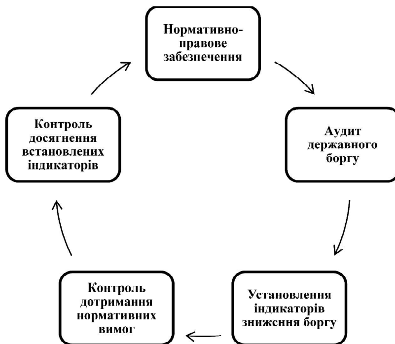
Рис. 2. Алгоритм роботи з програмного скорочення зовнішніх запозичень

У зв'язку із ситуацією, яка склалася в Україні, швидкими темпами зростає необхідність у стримуванні нарощування зовнішнього державного запозичення. Таким чином, розробка програми адаптації скорочення державного боргу в промисловому середовищі виконує реінженірингову функцію в економіці в цілому, завдяки охопленню та перерозподілу потоків у різних сферах економічної активності. Найбільш дієвим методом покращення фінансово-економічного стану є вдосконалення нормативно-правових актів: Цивільного кодексу