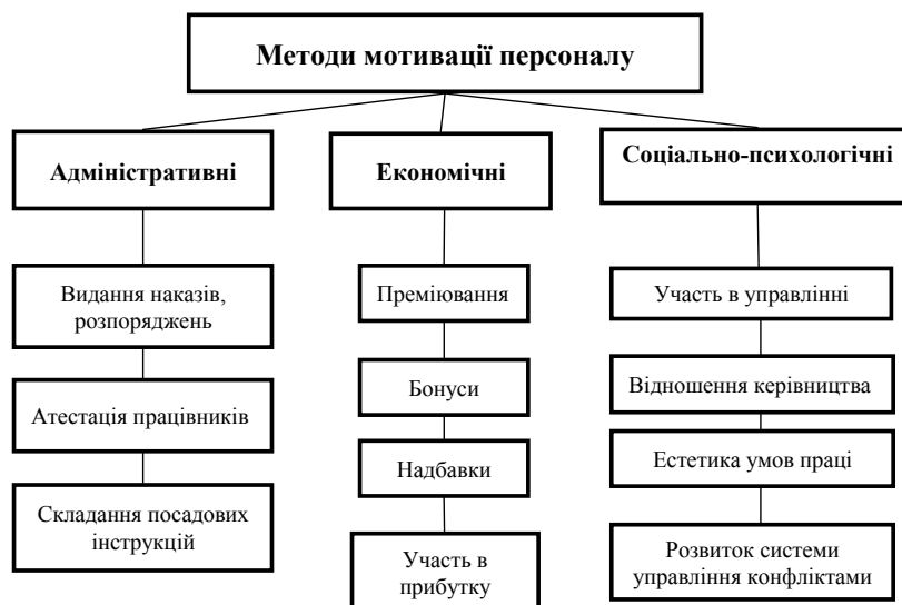
Рис. 4. Методи мотивації персоналу