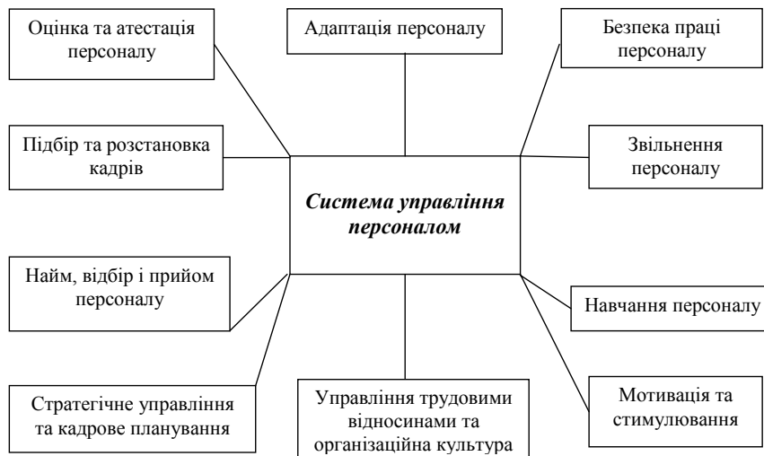
Рис. 1. Система управління персоналом банківської установи