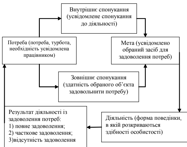
Рис. 2. Процес мотивації персоналу