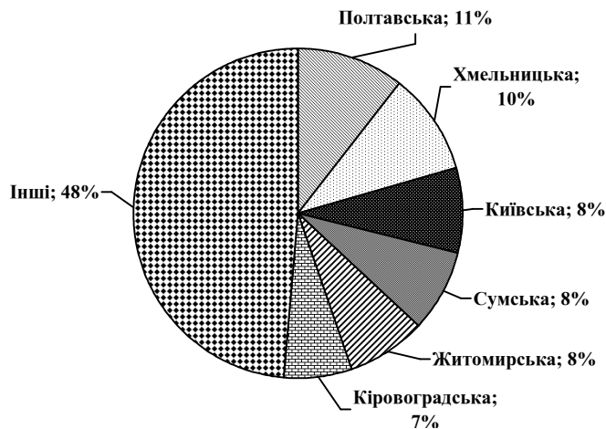
Рис. 3. Регіони з найбільшими посівними площами сої в Україні та їх частка у загальній структурі в 2018 р., %