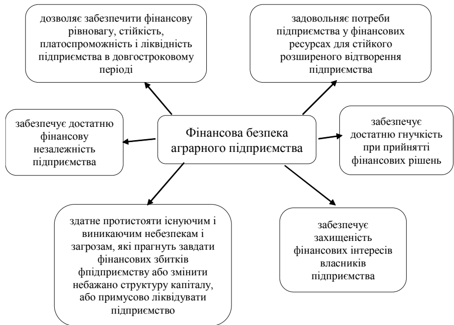
Рис. 4. Схема фінансової безпеки аграрного підприємства

Забезпечення сталого зростання аграрного підприємства неможливо без розробки і проведення самостійної стратегії підприємства, яка в сучасній економіці визначається наявністю ефективної системи його фінансової безпеки. Ефективність діяльності господарюючих суб'єктів в ринковій економіці обумовлюється багато в чому станом його фінансів, що призводить до необхідності розгляду проблем забезпечення фінансової безпеки підприємства.