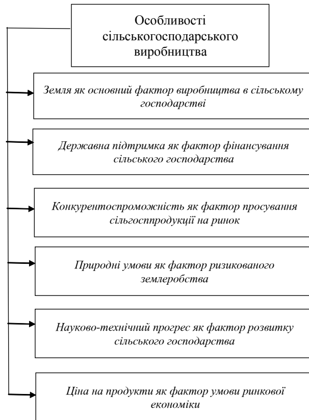
Рис. 3. Особливості сільськогосподарського виробництва

господарство. Щоб пом'якшити вплив цих об'єктивних факторів, потрібно земельні угіддя, незалежно від форм власності, розглядати як загальнонаціональне надбання, витрати на їх збереження, а також витрати, пов'язані з формуванням соціальної інфраструктури села, розвитком сільських територій, повинні фінансуватися з бюджетів всіх рівнів.