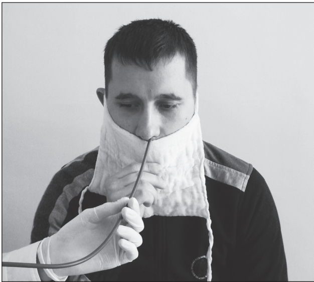
Рисунок 1. Методика місцевої анестезії бронхів методом закапування

Таким чином, удосконалення способів точного сегментарного введення препаратів є актуальною проблемою фтизіатрії, що дозволить підвищити ефективність лікування хворих на деструктивний туберкульоз легень з локалізацією специфічного процесу у верхівок сегментах легенів та покращить переносимість проти-туберкульозної хіміотерапії.