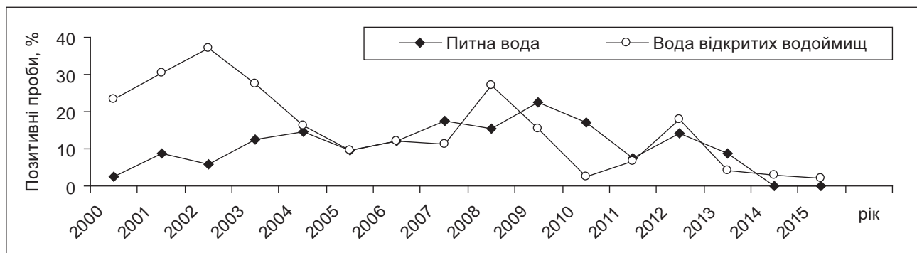
Рисунок 3. Вміст антигенів HAV у пробах питної води та у воді відкритих водоймищ

Існуючі дані вірусологічного моніторингу питної води розподільчої мережі міста не свідчать про складну епідемічну ситуацію щодо ВГА. Поряд із тим також не спостерігається кореляції між виявленням вірусних антигенів HAV у пробах води з водосховищ, з яких безпосередньо проводять забір для подальшої очистки, та у питній воді (рис. 3).