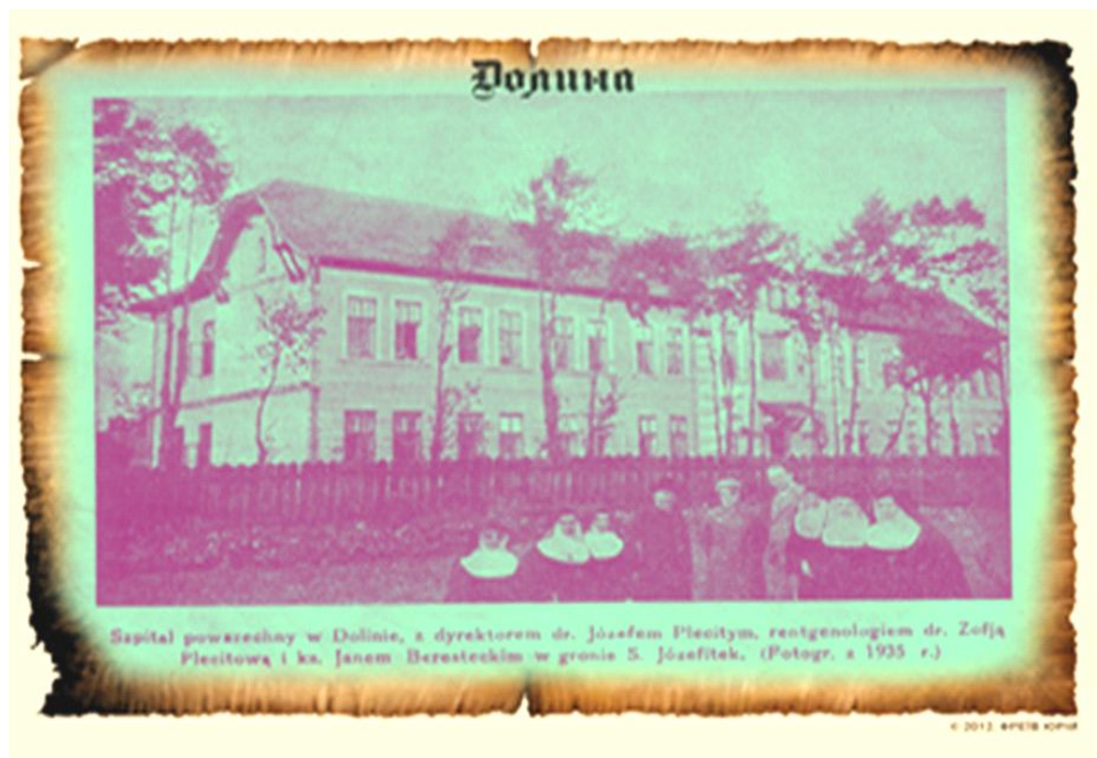
Фото 2. Повітова лікарня. м. Долина (1935 р.)

В перші післявоєнні роки одним із завдань ліквідації наслідків війни було відновлення мережі лікувальних закладів і забезпечення ефективного медичного обслуговування населення з допомогою активних протиепідемічних заходів значно знижено рівень захворюваності на небезпечні інфекційні захворювання. Мережа лікувальних закладів розширювалась, приводилася у відповідність до потреб і кількості населення району. Першим повоєнним головним лікарем лікарні був хірург Федір Куніцький. У 1949 р. медичну установу очолив знаний на Прикарпатті хірург, заслужений