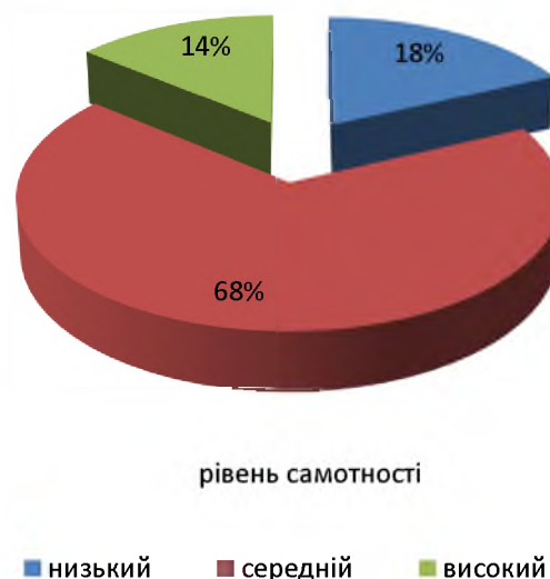
Рис.3. результати дослідження рівня самотності

Як засвідчують емпіричні дані 18% опитаних респондентів мають низький рівень суб'єктивного відчуття самотності (тобто не відчують себе самотніми); у переважачої більшості - 19 учнів (68%) було діагностовано середній рівень самотності; 4 учні (14%) - високий рівень суб'єктивного відчуття самотності (тобто відчують себе дуже самотніми).