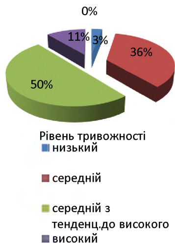
Рис. 1. Показник рівня тривожності

Як видно з отриманих результатів, в групі опитаних 1 учень (3%) має низький рівень тривожності; 10 учнів (36%) - тривожність, що відповідає середньому рівню; у 50% досліджуваних - 14 учнів діагностовано середній рівень тривожності з тенденцією до високого; високий рівень виявлено у 3 учнів (11%). Дуже високого рівня тривожності в групі діагностовано не було.