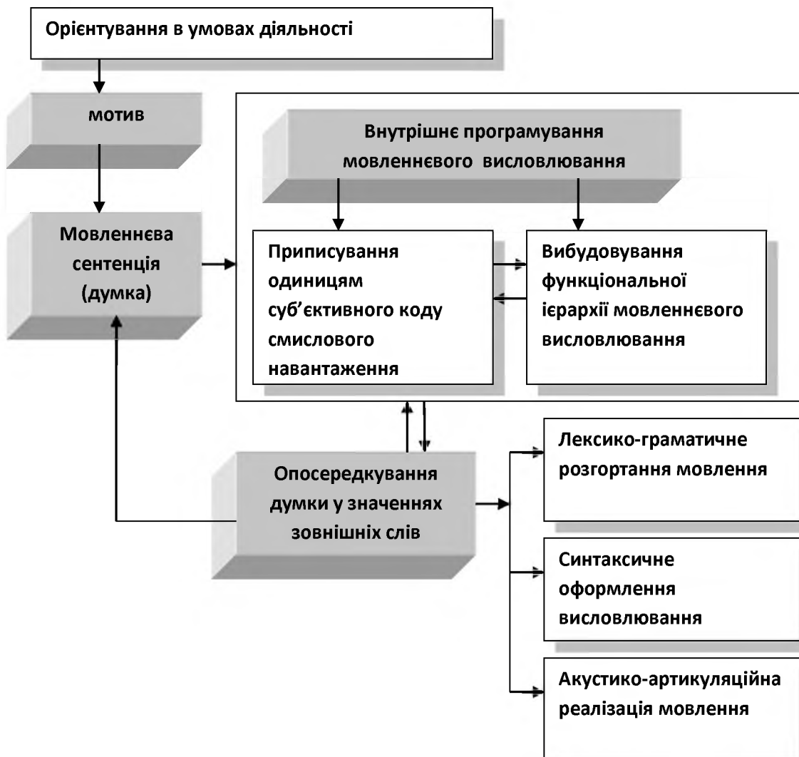
Рис.2. - Модель породження мовлення (за О.О.Леонтьєвим)

Більш структуровано інтерпретує процес породження мовлення як послідовність взаємопов'язаних фаз діяльності О.О.Леонтьєв [4; 5], модель якого (рис.2.) створена на підставі фундаментального аналізу концептуальних положень теорії мовленнєвої діяльності Л.С.Виготського та теорії діяльності О.М.Леонтьєва.