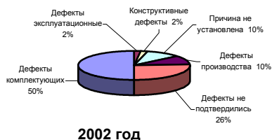
Рис. 2. Структура отказов БППД2-1

Результаты исследования отказавших блоков БППД2-1 за последние годы эксплуатации, причины и структура отказов представлены на рис. 2