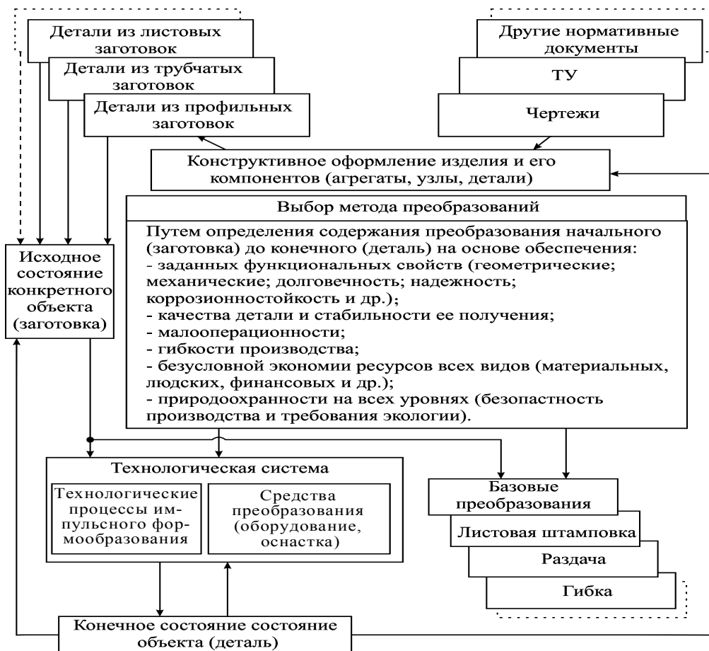
Рис. 3. Содержание принятого подхода к выбору технологической системы