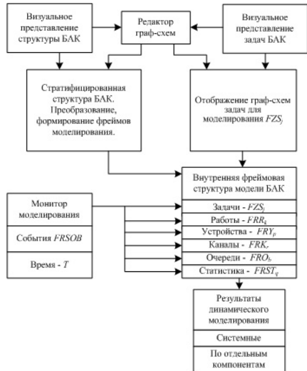
Рис. 2. Блок-схема динамического моделирования БАК

В работе предложен метод контроля основных характеристик проектируемого беспилотного авиационного комплекса, основанный на знаниеориентированных структурах в имитационном моделировании. Предлагаемый метод позволяет универсально оценить основные характеристики БАК на различных этапах проектирования, начиная от формирования технических требований и кончая изготовлением опытных образцов БАК.