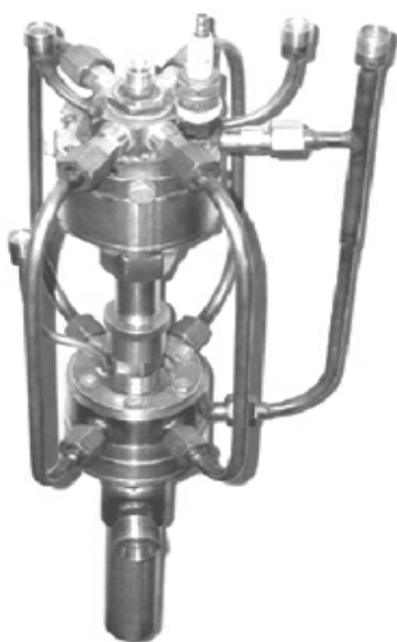
Рис. 1. Внешний вид двухкамерной горелки для ВВТН «Град-В»

В ИПМ НАН Украины разработана схема газодинамического тракта горелочных устройств для ВГПН с расходным управлением параметрами газового потока, позволяющая в 1,5 – 2 раза повысить эффективность процесса межфазного теплообмена без заметной потери скорости частиц [9]. По этой схеме выполнена двухкамерная горелка для ВВТН «Град-В», показанная на рис. 1.