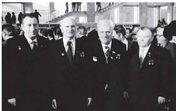
Главные конструкторы. Слева-направо: В. Ф. Уткин, В. П. Глушко, Н. А. Пилюгин, В. Г. Сергеев

В 70-х – начале 80-х годов КБ «Электроприборостроения» вело разработки систем управления по комплексам уже пяти Главных конструкторов: В. Ф. Уткина (сменившего на посту Главного конструктора КБЮ М. К. Янгеля), В. Н. Челомея (ЦКБМ), Д. А. Полухина (КБ «Салют»), М. Ф. Решетнёва и В. М. Ковтуненко, ставшего Главным конструктором НПО им. С. А. Лавочкина.