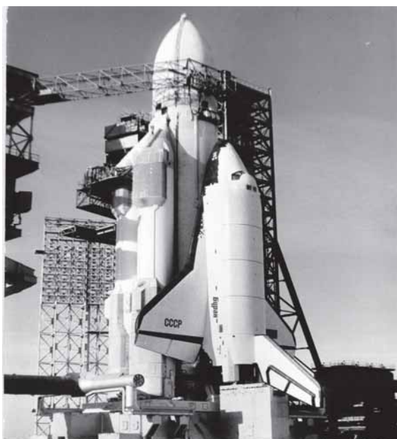
Ракета-носитель «Энергия» с кораблем «Буран»

Значительное место в научно-техническом творчестве коллектива НПО «Электроприбор» занимало создание системы управления ракеты-носителя многоразовой транспортной космической системы «Энергия-Буран».