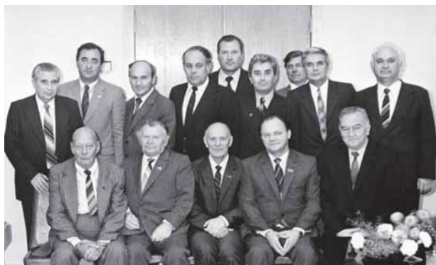
Встреча с президентами Академий наук СССР и УССР А. П. Александровым и Б. Е. Патоном

Академик В. Г. Сергеев всегда оставался скромным, простым и доступным для коллег и подчиненных. Он отказался от установки своего бюста в Москве, который мог быть установлен ему как дважды Герою Социалистического Труда. Добрый и отзывчивый человек, он очень много сделал для сотрудников своего предприятия.