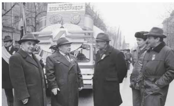
На демонстрации с коллегами

Если вопрос требовал решения на уровне городских или областных руководителей, он надевал все свои «регалии» и ехал к нужному высокопоставленному чиновнику и, как правило, вопрос был решен.