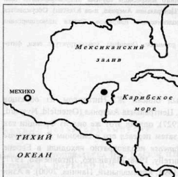
Рис. 1. ● — Местонахождение оз. Эль Падре (Центральная Америка, Мексика, штат Куинтана Роо, п-ов Юкатан).

Образцы водорослей, в которых был найден P. gatunense , отбирали с помощью планктонной сетки из оз. Эль Падре 28 апреля 2001 г. (Центральная Америка, Мексика, штат Куинтана Роо, п-ов Юкатан, 19° 36' 23" зап. д., 87° 59' 17" сев. ш., рис. 1). Данный водоем небольшой, овальной формы, относительно глубокий, в среднем 8,77 м, 111,5 м дл., 108,4 м шир. Во время отбора проб температура воды в нем была 25,5 °С, рН 9,5, электропроводность составляла 1,2 мС/см -1 , содержание NO 3 - 5,3 мМ, NO 2 - 0,15 мМ, PO 4 3- 0,011 мМ.