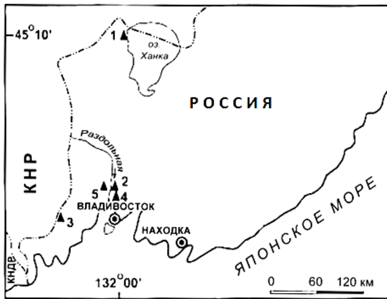
Рис. 1. Расположение групп разрезов неогеновых отложений в южной части Приморья: 1 – голостратотип новокачалинской свиты (средний миоцен); 2 – гипостратотип усть-суйфунской свиты (верхний миоцен); 3 – гипостратотип синеутесовской свиты (нижняя часть нижнего миоцена); 4 – опорные разрезы шуфанского горизонта (плиоцен); 5 – опорные разрезы нежинской свиты (верхняя часть нижнего миоцена)

Материалом для диатомового анализа послужили полевые многолетние исследования неогеновых толщ Приморья. Изучено более 30 разрезов, имеющих палеоботаническую и радиометрическую характеристики (Павлюткин и др., 1993, 2004; Павлюткин, Петренко, 2010). Основное внимание при изучении комплексов диатомей в неогеновых отложениях уделено стратотипам и опорным разрезам горизонтов и свит (рис. 1).