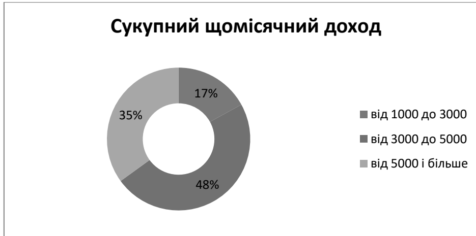
Рис. 4. Структура споживачів бренда одягу «LC Waikiki» за доходом

Побудований профіль споживача бренда одягу «LC Waikiki» дає підстави констатувати, що найбільш лояльними до бренда споживачами є неодружені молоді люди (студенти та працюючі), з невисоким сукупним місячним доходом, які в більшості мешкають у місті.