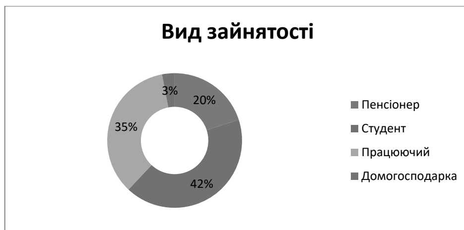
Рис. 3. Структура споживачів бренда одягу «LC Waikiki» за видом зайнятості