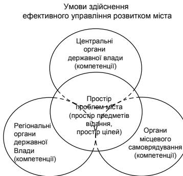
Рис. 2. Умови здійснення ефективного управління розвитком міста

Крім цього, важливим фактором ефективного управління є повнота представлення проблемного простору розвитку міста як передумова (у логіці рис.1) повноти простору предметів відання та повноти простору цілей розвитку міста. У свою чергу, повнота представлення проблем розвитку міста виступає передумовою забезпечення повноти охоплення проблем розвитку міста суб'єктами управлінської дії (для міста – це органи державної влади центрального та регіонального рівнів та місцевого самоврядування). Повнота сукупного охоплення і неперетинання управлінських компетенцій при вирішенні проблем розвитку міста є очевидними факторами ефективного управління розвитком міста. Логіку реалізації вимог: повноти охоплення проблемного простору міста компетенціями суб'єктів управління і не перетинання цих компетенцій як умов ефективного управління унаочнює схема (рис. 2).