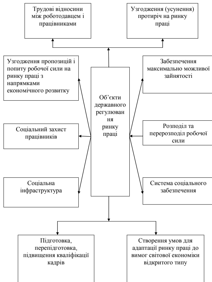
Рис. 2. Об'єкти державного регулювання ринку праці

Під принципами управління розуміють керівні правила, основні положення, норми поведінки, що відображають найбільш стійкі риси законів і закономірностей управління, яких необхідно дотримуватися в управлінській діяльності.