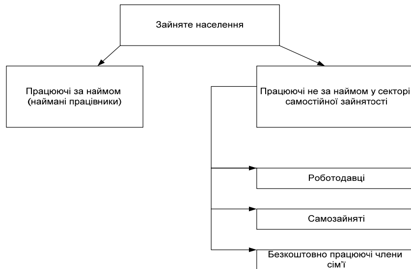
Рис. 3. Класифікація статусів зайнятості населення (за методологією МОП)

Поряд з класифікацією статусів зайнятості населення дана концепція зайнятості передбачає методологічне визначення наведених статусів, розкриття таких понять, як безробітні, рівень безробіття, економічно неактивне населення, зневірені, середня тривалість незайнятості, професійна належність, рівень освіти та інші та обов'язкове врахування національних особливостей, нормативної бази і законодавчих актів.