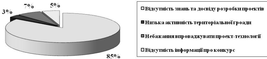
Рис. 1. Причини низької активності в конкурсі

Наразі для органів місцевого самоврядування Полтавщини існує можливість участі у Всеукраїнському конкурсі проєктів та програм розвитку місцевого самоврядування. У 2013 р. від Полтавської області було подано 37 проєктів, у той час від Дніпропетровської – 122 проєкти, Луганської – 108 проєктів. Проведене соціологічне дослідження (Шишацький, Машівський, Зінківський райони), у якому взяло участь 53 особи, визначило причини низької активності районів, серед яких найбільше респондентів (85 %) відзначили відсутність досвіду та знань у розробці проєкту (рис. 1).