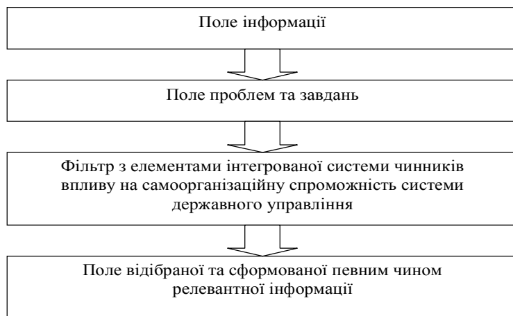
Рис. 3. Система відбору інформації для вирішення проблем та завдань державного управління на основі системи чинників впливу на самоорганізаційну спроможність системи державного управління

Для відповіді на це запитання, насамперед, звернемося до ідей роботи [2], в якій запропоновано інноваційний фільтр. Такий фільтр побудовано фактично з двох блоків: блоку відбору інформації та блоку власно виявлення ознак новизни. Можна взяти цю ідею за основу та побудувати систему відбору інформації для вирішення проблем та завдань державного управління, виходячи з елементів інтегрованої системи чинників впливу на самоорганізаційну спроможність соціальної системи, як це показано на рис. 3.