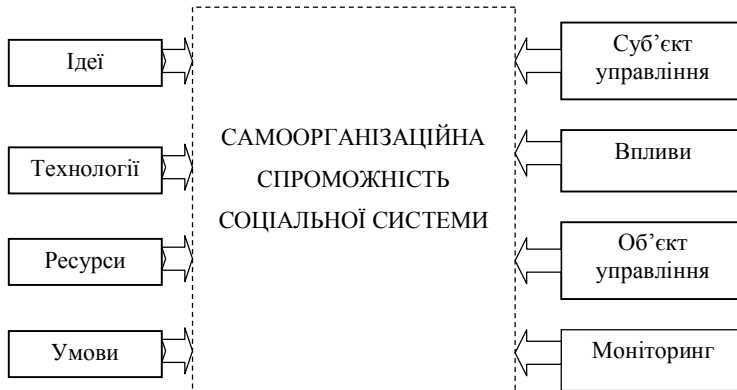
Рис. 2. Інтегрована система чинників впливу на самоорганізаційну спроможність соціальної системи

Що дає виділення інтегрованої системи чинників впливу на самоорганізаційну спроможність соціальної системи?