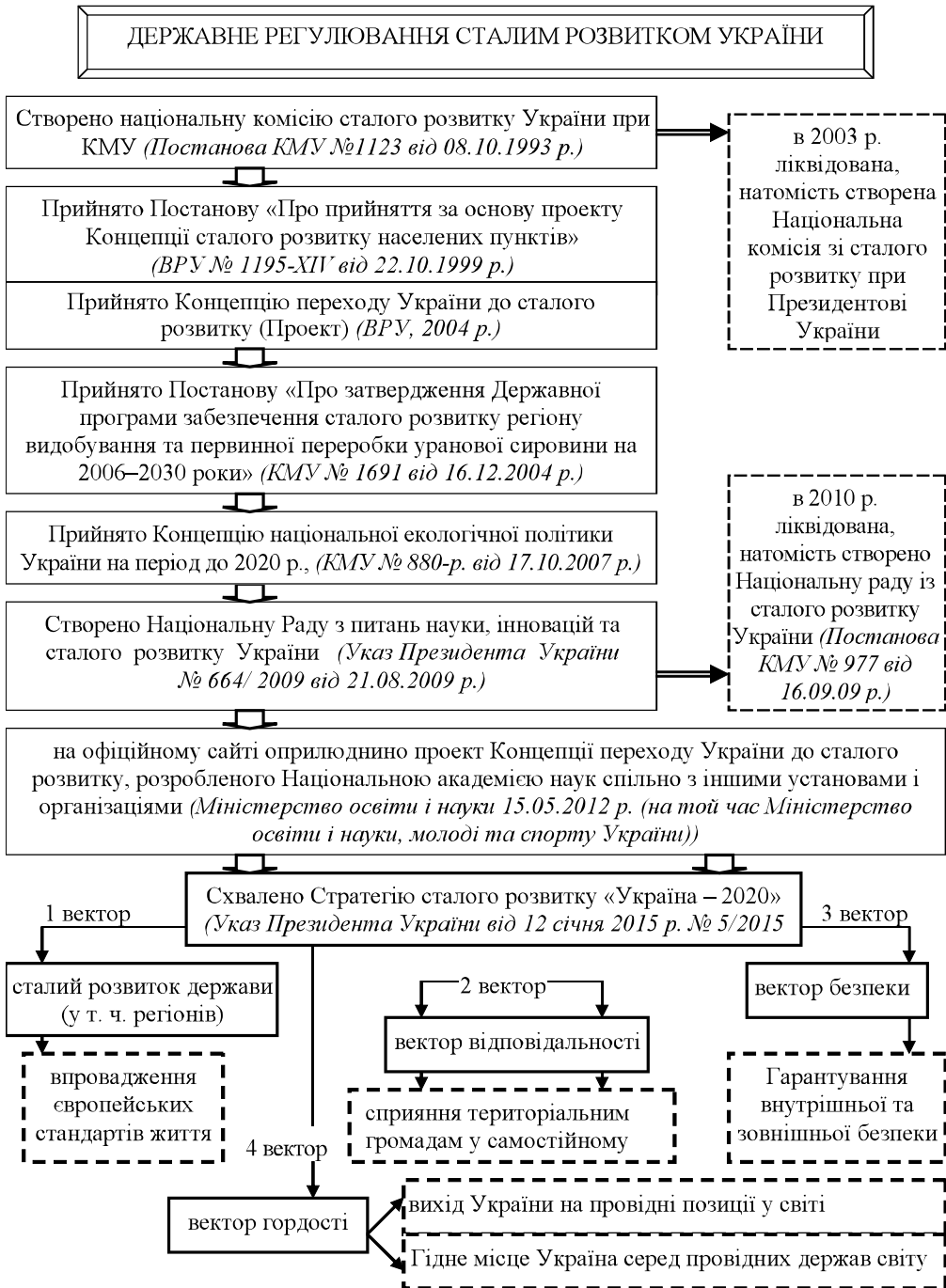
Рис. 2. Стратегічні засади державного регулювання сталим розвитком України*