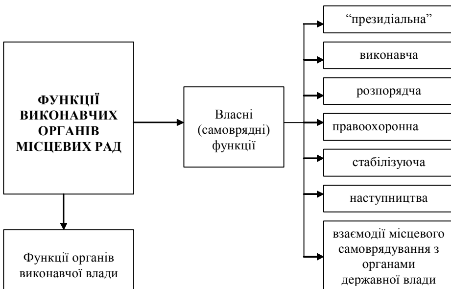
Рис. 3. Функції виконавчих органів місцевих рад

Дослідження сутності будь-якого органу публічної влади неможливе без з'ясування його функцій, яке допомагає розкрити місце та роль органу влади, а також його соціальне призначення. Організація місцевого самоврядування України передбачає здійснення виконавчими органами двох груп функцій: власних (самоврядних) та функцій органів виконавчої влади (рис. 3).