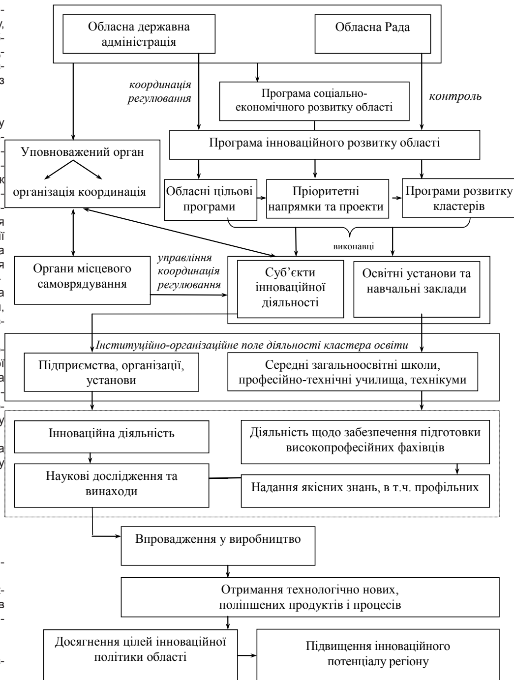
Рис. 1. Схема реалізації стратегії інноваційного розвитку регіону Складено на основі [1, с. 234 – 235; 2; 4; 7; 8]

У якості більш детальних форм реалізації кластерної політики можна запропонувати її методичний супровід, проведення організаційних заходів (конференцій, круглих столів), розроблення нормативно-правових актів, що стосуються реалізації кластерної ініціативи та розвитку кластерів, пошук джерел фінансового забезпечення для розвитку інфраструктури кластерів, створення центрів навчання та підготовки кадрів [5, с. 45]. Ведучи мову