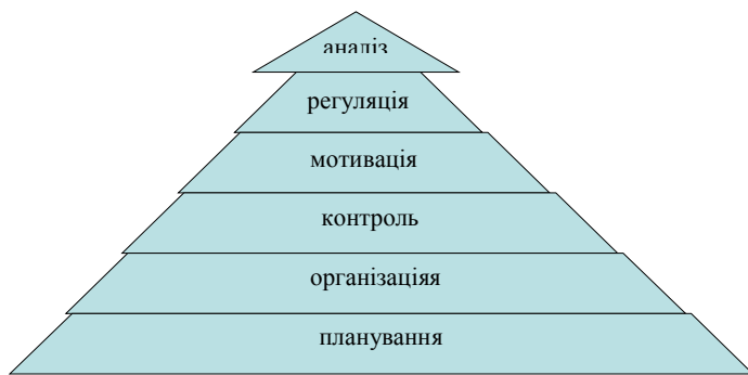
Рис. 2. Загальні функції менеджменту

готовлені спеціалісти формують організації та керують ними шляхом постановки цілей та розробки засобів їх досягнення. Фундаментальний Оксфордський словник англійської мови трактує «менеджмент» так, як показано на схемі (рис. 1).