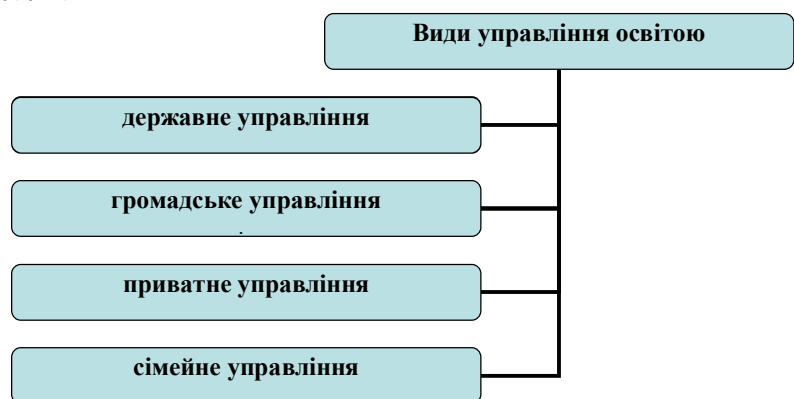
Рис. 3. Видова класифікація управління

Більш детально зупинемось на державному і громадському управлінню освітою.