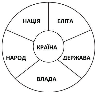
Рис. 2. Солярний принцип побудови взаємовідносин народу та держави

і народу. Автор пропонує варіант консолідуючої національної ідеї у вигляді комплексу принципів п'яти «Д»: держава, духовність, дисципліна, демократія, добробут, який може об'єднати діаметрально протилежні політичні табори еліти України, вказати Українському народу шлях до кращого майбутнього, тобто шлях досягнення добробуту через міцну державу, побудовану на засадах демократії, духовності та дисципліни права. Запропонований комплекс принципів не виступає джерелом запеклих політичних протистоянь і, по суті, своїй є комплексом принципів консолідації багатонаціонального Українського народу, широкого спектру політичних сил. Це – комплекс принципів самовиживання Українського народу, країни, держави. Для наочності графічно комплекс принципів національної ідеї можна розмістити на тризубі, як малому Гербі України (див. рис. 3).