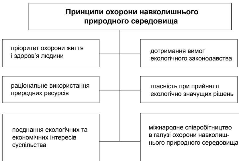
Рис. 2. Основні принципи охорони навколишнього природного середовища

л) встановлення екологічного податку, збору за спеціальне використання води, збору за спеціальне використання лісових ресурсів, плати за користування надрами відповідно до Податкового кодексу України.