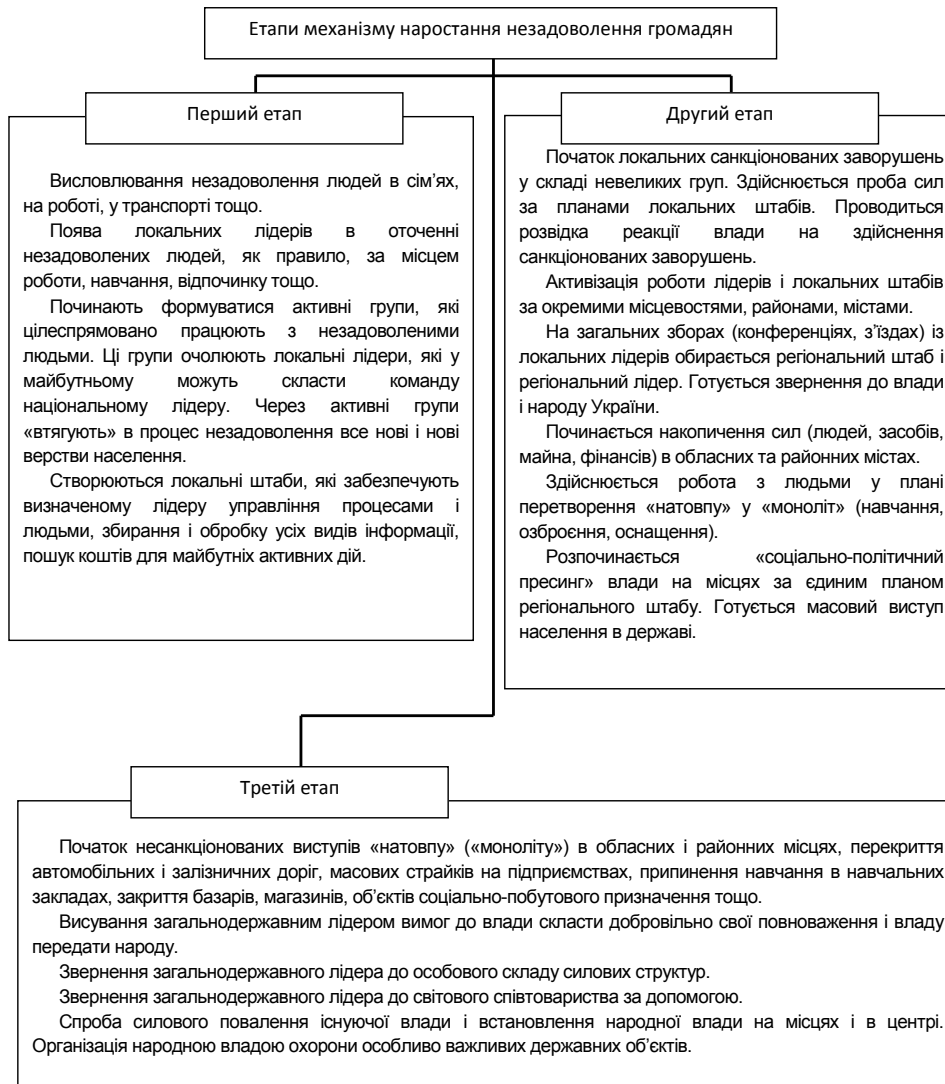
Рис. 1. Етапи механізму наростання незадоволення громадян та переростання їх до організованих заворушень

За висунутою гіпотезою здійснюється обґрунтування варіантів можливих ситуацій і передбачаються наслідки. Проведений аналіз дає підґрунтя щодо необхідних заходів та дій органів виконавчої влади у разі організації взаємодії суб'єктів регіонального рівня: