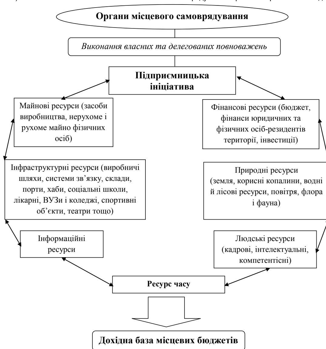
Рис. 1. Функціональна модель ресурсного забезпечення місцевих бюджетів

Трансферти з державного бюджету – кошти державного бюджету, які у вигляді дотацій та субвенцій спрямовуються до дохідної частини місцевих бюджетів і використовуються в таких основних напрямках: виконання власних і делегованих повноважень місцевого самоврядування в рамках вирівнювання податкоспро-