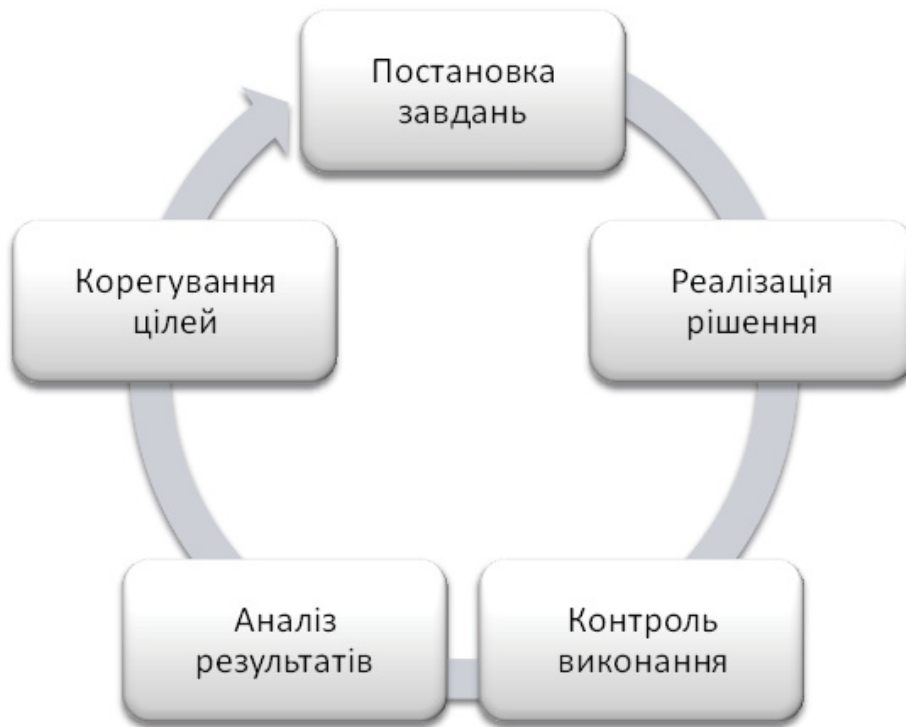
Рис. 3. Цикл прийняття управлінського рішення в органах публічного управління

них факторів на цей процес. Цикл прийняття рішень характеризується двома видами вимірювань: часом функціонування та просторовими обмеженнями. Тривалість циклу прийняття рішення визначається часом: збору та переробки інформації, розробки та прийняття рішення, організації виконання рішення. В системі прийняття рішень суб'єктом управління В. Колпаков визначає три основних цикли: інформаційний (пошук, збір, передача, обробка та збереження інформації); логіко-мисленнєвий (розробка та прийняття управлін-