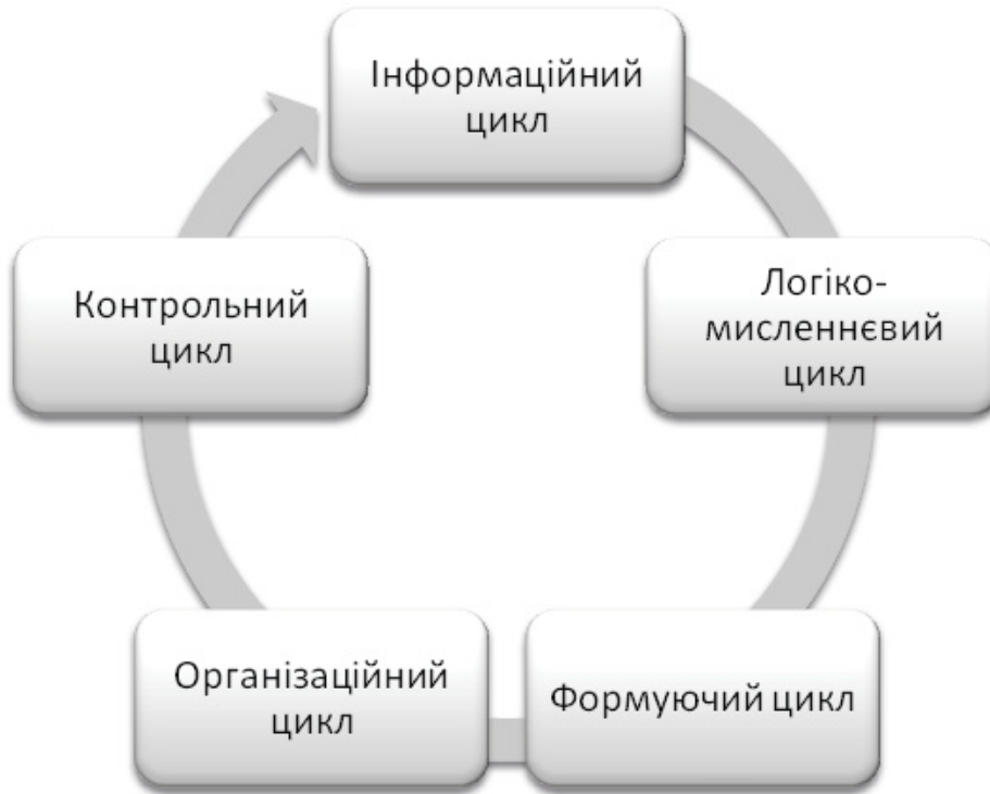
Рис. 4. Циклічність формування управлінського рішення в органах публічного управління

3. Ивлєв А. А. Основы теории Бойда. Направление развития, применения и реализации : монография / А. А. Ивлєв. – М., 2008. – 105 с.