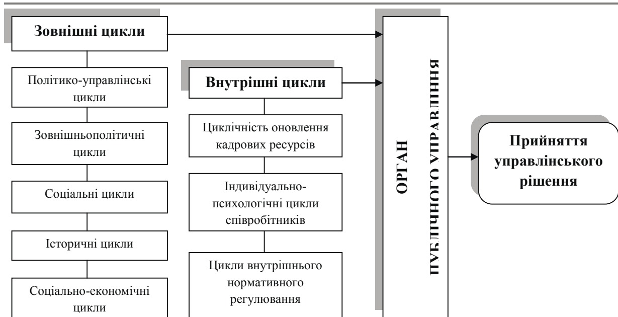
Рис. 1. Ієрархічність циклів в системі прийняття рішення органом публічного управління

людей та їх відношенні до прогнозування майбутнього. Позитивні оцінки людьми соціально-економічної ситуації збільшують їх життєву активність та обумовлюють фазу підйому соціально-економічного циклу. При песимістичних оцінках майбутнього люди знижують активність, чим провокують соціально-економічний спад. Л. Грінін встановив, що психологічні фактори (настрій, очікування, довіра) зазвичай супроводжують інші фактори прийняття рішень. Г. Хаберлер вказує, що психологічна теорія циклу органічно поєднується з іншими циклічними теоріями [7].