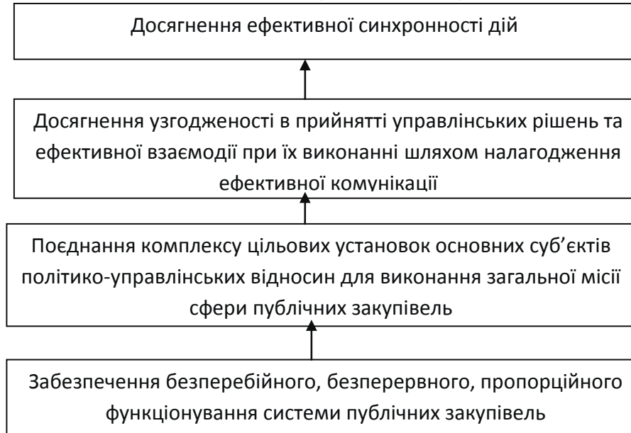
Рис. 1. Ієрархічність цілей синхронізації політико-управлінських відносин.

Отже, ціль синхронізації політико-управлінських