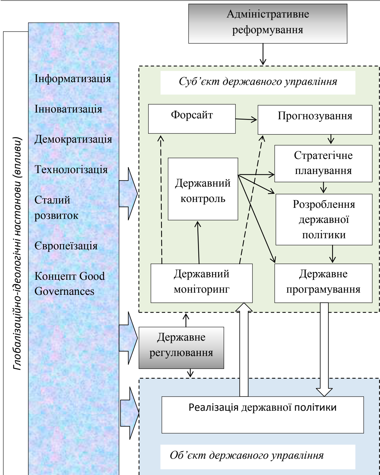
Рис. 2. Базові механізми у системі державного управління.

інформаційних технологій в цю систему. Поступово реалізується концепт «електронний уряд», завданням якого є охоплення владних структур інформаційними мережами з простим й одночасно захищеним доступом та зручними і достатньо простими технологіями роботи з інформацією, електронізація менеджерських та інших управлінських функцій, максимальне вилу-