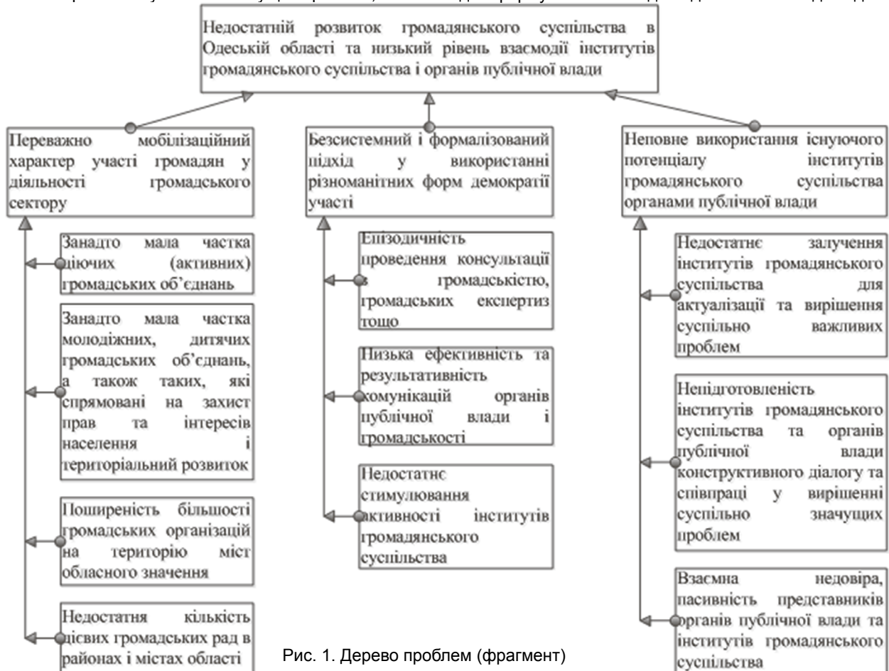
Рис. 1. Дерево проблем (фрагмент)

Отже, досягнення головної (стратегічної) мети зазначеної програми передбачається через досягнення наступних конкретних цілей: забезпечити подальший збалансований розвиток інститутів громадянського суспільства; забезпечити системну участь громадськості у формуванні та реалізації державної, регіональної політики, вирішенні питань місцевого значення; стимулювати співпрацю інститутів громадянського суспільства і органів публічної влади на засадах партнерства щодо актуалізації та вирішення суспільно значущих проблем територіального розвитку. Зауважимо, що нижній рівень дерева цілей, який містить результати декомпозиції конкретних цілей, може використовуватися для формулювання завдань діяльності та відповідних