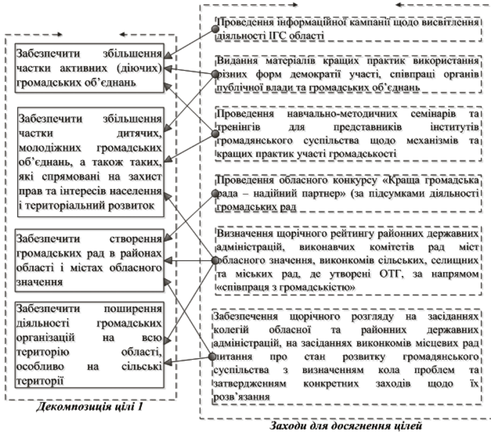
Рис. 3. Взаємозв'язок підцілей цілі 1 та заходів для їх досягнення.