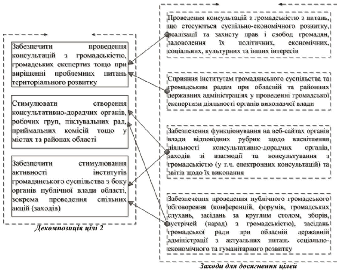
Рис. 4. Взаємозв'язок підцілей цілі 2 та заходів для їх досягнення.