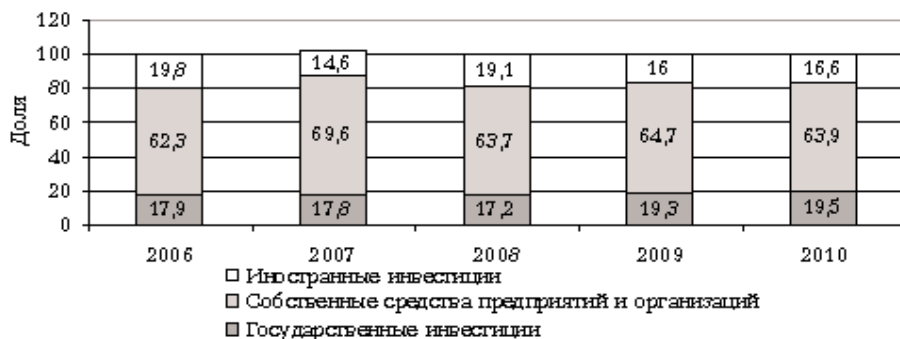
Рис. 1. Структура инвестиций в основной капитал по источникам финансирования в Республике Казахстан за 2006–2010 гг., %, рассчитано по данным [10]

Основными инвесторами являются отечественные предприятия и организации. В 2010 г. объем вложенных ими средств составил 2693,3 млрд. тенге, или 66,6%. В последние годы государство активизирует свою позицию на финансовом рынке. За 2004–2010 гг. удельный вес его вложений в основной капитал возрос с 8 до 19,5%, или на 11,5 проц. пунктов. Принципиальным изменением стало также сокращение доли средств иностранных компаний, что свидетельствует о постепенном снижении зависимости Казахстана от иностранного капитала (рис. 1).