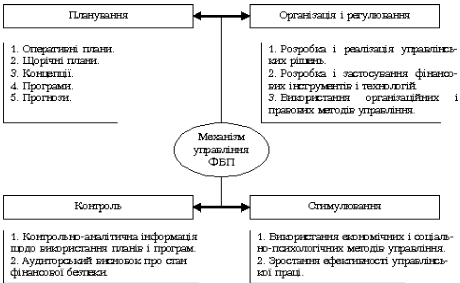
Рис. 2. Функціональна структура механізму управління ФБП [6]

Суб'єктом управління в процесі стимулювання виступає та ж оргструктура, яка застосовує сукупність економічних і соціально-психологічних методів управління. Контроль у вигляді обліку, аналізу й аудиту являє собою зворотний зв'язок між наміченими на підприємстві фінансовими цілями і мірою їх реалізації. Тому можна говорити про функціональну структуру управління фінансовою безпекою підприємства (рис. 2).