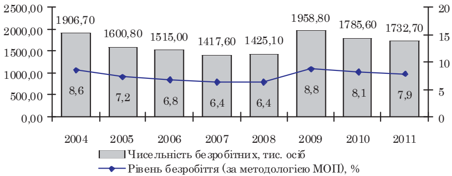
Рис. 2. Динаміка безробіття населення (за методологією МОП) України у 2004–2011 рр. [6]

З метою реалізації Програми економічних реформ на 2010–2014 рр. «Заможне суспільство, конкурентоспроможна економіка, ефективна держава» [3] в 2011 р. Державною службою зайнятості відкрито доступ до отримання громадянами соціальних послуг у будь-якому центрі зайнятості, незалежно від місця проживання чи перебування, зокрема пошуку належної роботи та працевлаштування, залучення до участі в оплачуваних громадських роботах, проведення професійної підготовки, перепідготовки й підвищення кваліфікації. Так, у 2011 р. до професійного навчання за направленням служби зайнятості було залучено 215,6 тис. безробітних громадян (на 12,4 тис. осіб більше за рівень 2010 р.). Рівень охоплення профнавчанням зріс з 14,7% до 15,4%. У зазначений період до оплачуваних громадських робіт було залучено 363,0 тис. осіб (на 44,8 тис. більше, ніж у 2010 р.) [9].