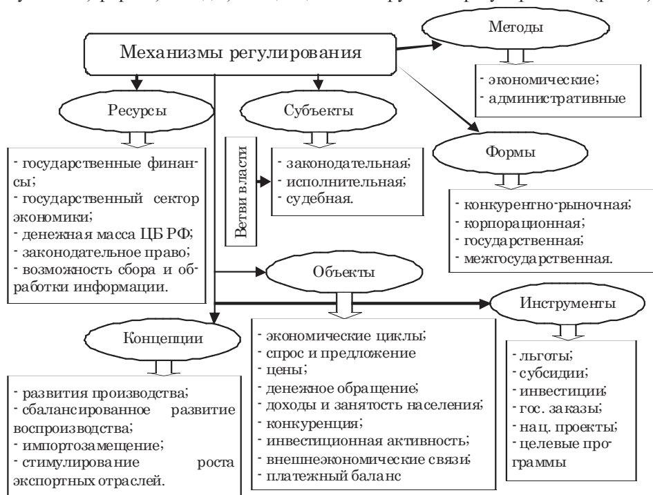
Рис. 1. Механизмы государственного регулирования экономики, авторская разработка

Механизм регулирования экономики включает ресурсы, объекты, субъекты, формы, методы, концепции и инструменты регулирования (рис. 1).