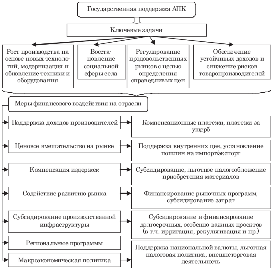
Рис. 4. Принципиальная схема государственной поддержки АПК на основе группы финансовых мер воздействия, авторская разработка

Согласно Государственной программе развития сельского хозяйства и регулирования рынков сельскохозяйственной продукции, сырья и продовольствия на 2013–2020 гг., в период с 2014 по 2015 гг. из бюджета страны будет выделено 160693797,9 тыс. руб. и 174385701 тыс. руб. соответственно [2]. Отдельной Государственной программой предусматривается финансирование рыбохозяйственного комплекса России – 10479975,1 тыс. руб. на 2013 г., 10190553,3 тыс. руб. на 2014 г. и 10231669,6 тыс. руб. на 2015 г. [2]. 5 лет назад бюджетные ассигнования из федерального бюджета на развитие сельского хозяйства и рыболовства составляли всего 34,5 млрд руб.