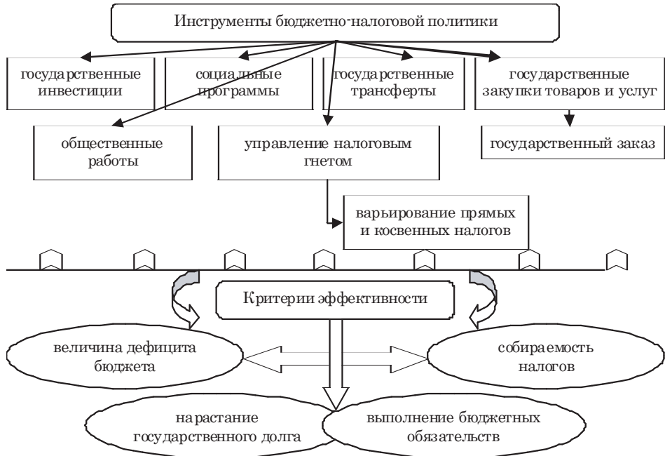
Рис. 2. Инструменты бюджетно-налоговой политики и критерии их эффективности, авторская разработка

Фискальная (бюджетно-налоговая) политика направлена на сглаживание деловых циклов и обеспечение экономического роста страны путем манипулирования государственным бюджетом. Для реализации конкретных макроэкономических целей фискальной политики (увеличения занятости, поддержания низких и стабильных темпов инфляции, подъема общественного благосостояния и т.д.) правительство использует различные инструменты, схематично представленные на рис. 2.