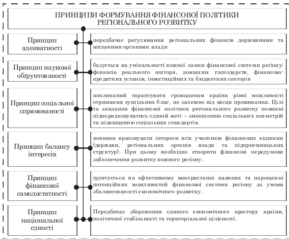
Рис. 3. Основні принципи формування фінансової політики регіонального розвитку, складено на основі [1; 2; 8; 13]

З метою концептуальної визначеності розуміння фінансової політики регіонального розвитку важливо виокремити принципи її формування, тісний взаємозв'язок функціонування яких здатен забезпечити результативність фінансової політики регіонального розвитку (рис. 3).