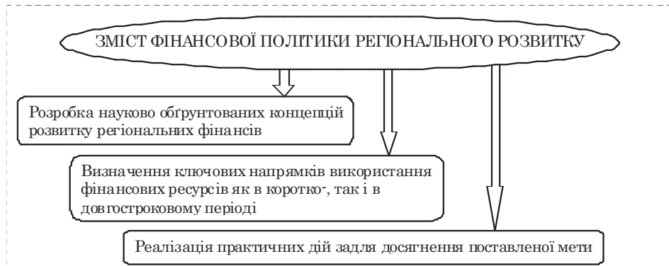
Рис. 1. Зміст фінансової політики регіонального розвитку, складено на основі [5; 8; 12]

Викладений вище теоретичний апарат з визначення сутності державної фінансової політики дозволяє сформулювати уявлення про зміст поняття «фінансова політика регіонального розвитку». Фінансова політика регіонального розвитку, з однієї сторони, є стрижнем регіональної політики і визначається специфікою економіки регіону, з іншого – є складовою державної фінансової політики і проводиться в умовах обмеженого економічного суверенітету. Зміст фінансової політики регіонального розвитку, на думку автора, розкривається через гармонійне поєднання наступних складових: вироблення науково обґрунтованих концепцій розвитку регіональних фінансів; визначення ключових напрямків використання фінансових ресурсів як в коротко-, так і в довгостроковому періоді; реалізація практичних дій задля досягнення поставленої мети (рис. 1).