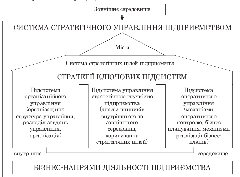
Рис. 1. Управління стратегічною гнучкістю підприємства в системі стратегічного управління підприємством [9, 28]

Отже, система управління стратегічною гнучкістю у загальному розумінні являє собою сукупність структурних елементів підприємства, зв'язків та відносин між ними, які забезпечують реалізацію встановлених цілей з урахуванням змін у зовнішньому середовищі.